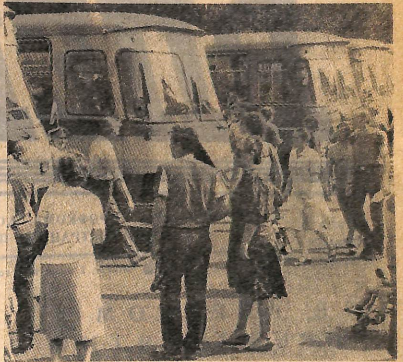
Первые дни долгожданного лета. Волнение, хлопоты, сборы... Только в первую смену в пионерском лагере «Дружба» отдохнут 330 мальчишек и девчонок, 300 — в городском лагере «Орленок», 80 — в «Южном», 170 укрепят свое здоровье в спортивном лагере, организованном при средней школе № 9.